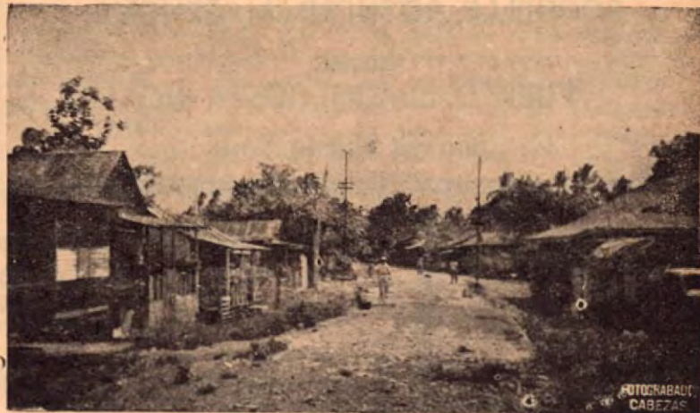
Una calle del barrio de Cieneguita en Limón.

Existe una completa armonía entre los señores integrantes del Municipio y la Gobernación de la Provincia. Esto está permitiendo una labor en todo sentido armónica, con indudable beneficio para la colectividad limonense. Son muchas las obras que están proyectándose realizar y en las últimas sesiones la Municipalidad porteña ha venido estudiando sus recursos económicos, cabalmente para contar con un presupuesto adecuado para las nuevas obras en proyecto, algunas de las cuales, cuando esta revista esté circulando, ya se habrán iniciado.