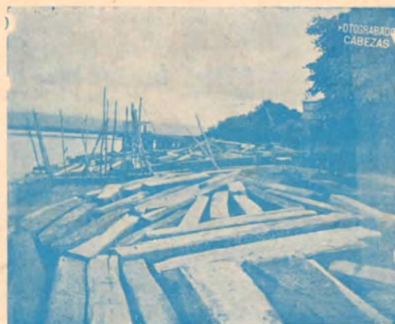
Madera en el puertecito de embarque

Nuestras maderas son distribuidas por las casas más serias en el ramo en SAN JOSE, como el