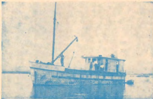
Lancha LA GAVIOTA

Una empresa al servicio del desarrollo industrial de la madera en Costa Rica.