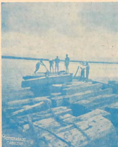
Amarre de la madera en el río.