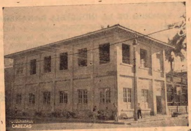
Escuela Tomás Guardia de Puerto Limón

Oficina 50 varas Oeste del Hotel Europa Contiguo Oficinas de la ANDE, Casa 47-0