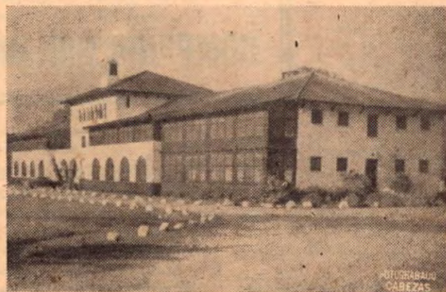
El Instituto Agrícola de Turrialba